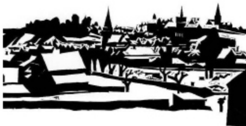
Panorama in Schwarz-Weiß: Dieser Holzschnitt von Lorenz Humburg zeigt die Ansicht von Warburg mit den spitzen Kirchtürmen.

waren in Warburg wohl bekannt. Am Hanekipperweg hatten die Humburgs als Erste gebaut. Ihr Haus ist puristisch und gradlinig – nach Art des Bauhaus-Stils mit einem flachen Dach und großen Fenstern. Dahinter erhebt sich das Warburger Stadtpanorama mit den spitzen Silhouetten der Fachwerk-